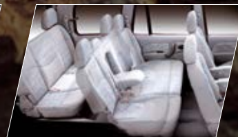
TRES CORRIDAS DE ASIENTOS (8 PASAJEROS)