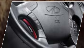
COMANDO DE RADIO Y CRUCERO AL VOLANTE