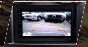
CÁMARA DE RETROCESO / DVD / MANOS LIBRES